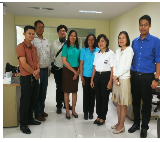
สนง.สาธารณสุขจังหวัดสมุทรปราการ 13 ก.พ. 63