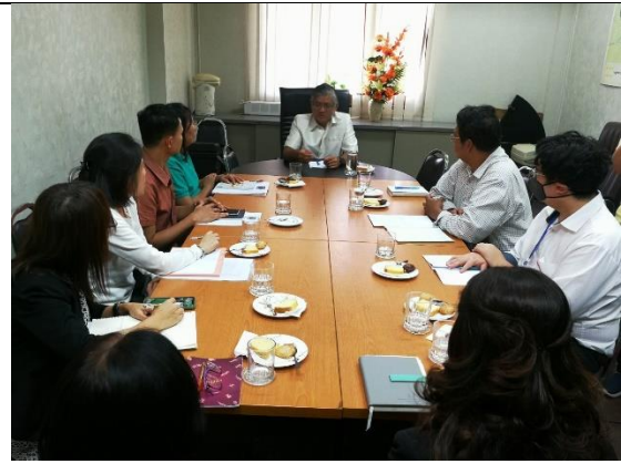
สนง.จังหวัดสมุทรปราการ 13 ก.พ. 63