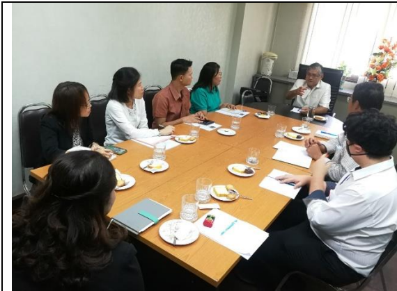
สนง.จังหวัดสมุทรปราการ 13 ก.พ. 63