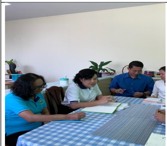
สนง.สาธารณสุขจังหวัดสมุทรปราการ 13 ก.พ. 63