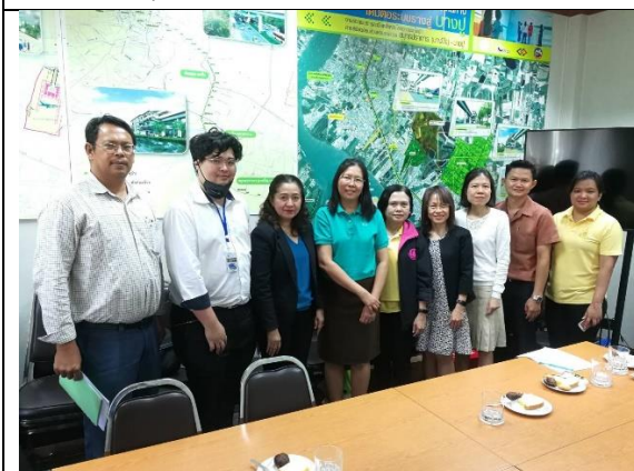
สนง.จังหวัดสมุทรปราการ 13 ก.พ. 63