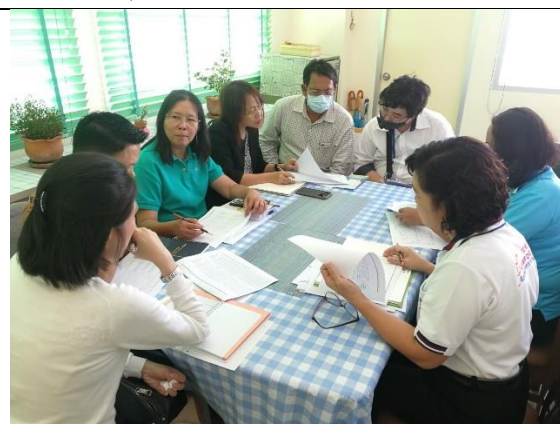
สนง.สาธารณสุขจังหวัดสมุทรปราการ 13 ก.พ. 63